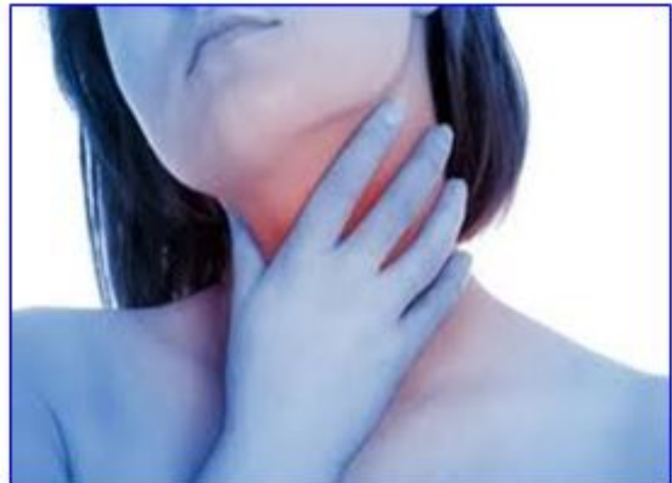
Viêm họng và sưng cổ là những triệu chứng thường gặp của bệnh bạch hầu