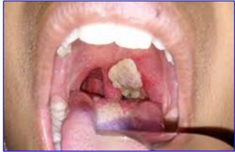
Màng giả trên lưỡi, vòm miệng do vi khuẩn bạch hầu gây ra